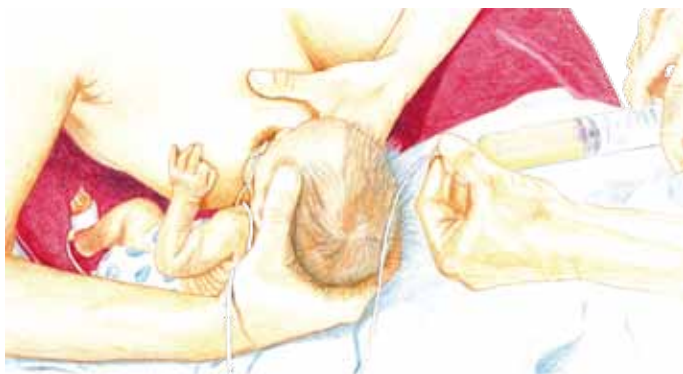
Sondieren während des Anlegens

Wenn das Baby aufhört aktiv zu trinken, pressen Sie die Brust vorsichtig rhythmisch zusammen, um den Milchfluss zu unterstützen. Immer wieder Pausen machen, um dem Baby die Atmung zu ermöglichen. Diese Methode kann Ihnen möglicherweise das Pumpen ersparen.