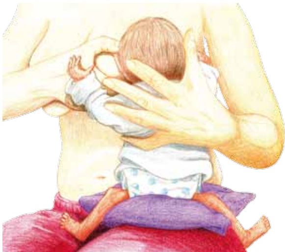
Hoppe Reiter Sitz