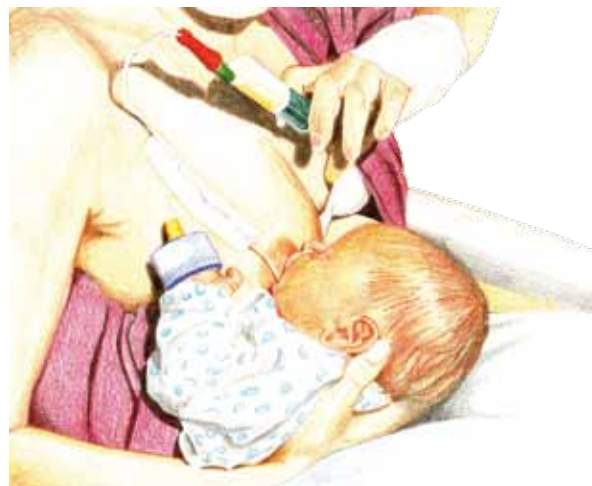
Zufüttern an der Brust