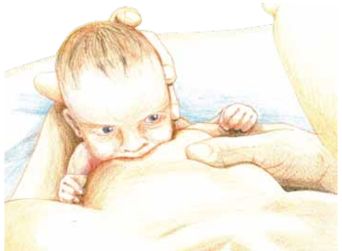
Hoppe Reiter Sitz über Mutters Schulter gesehen