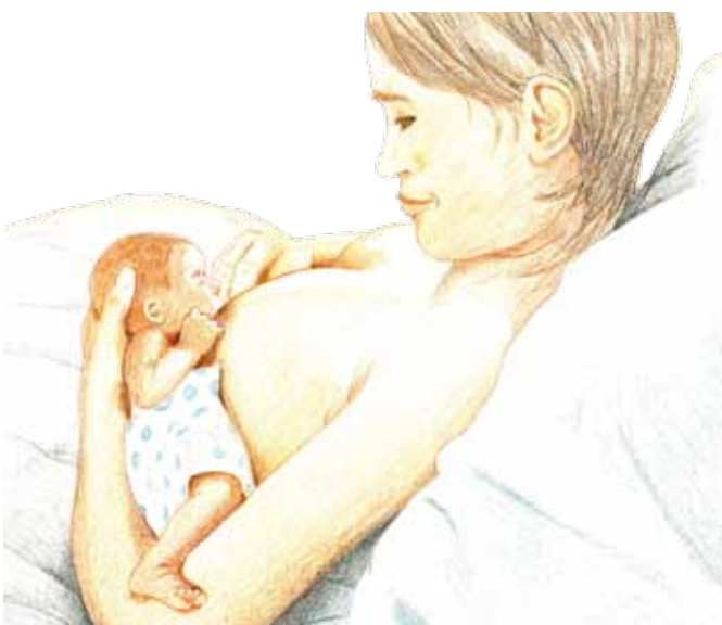
Hohe Rückenhaltung, aufrechte Haltung erleichtert die Koordination von Atmen, Saugen und Schlucken

Achten Sie darauf, bequem und entspannt zu liegen/sitzen. Eine weit geschnittene, weiche, leichte Jacke ermöglicht Ihnen, das Baby und sich selbst etwas zu bedecken, nachdem Sie es sich zusammen bequem gemacht haben. Ihr Arm, der Ihr Baby hält oder Ihr Baby selbst müssen mit einem festen Polster gut gestützt sein, um es während der voraussichtlich längeren Stillzeit immer gut mit dem Mund auf Höhe der Brustwarze halten zu können. Ihr Baby stillt am bequemsten, wenn es in der natürlichen Beugehaltung ist. Helfen Sie ihm, Arme und Beine angebeugt nach vorne zu bringen. Ohr, Schulter und Hüfte sollen auf einer Linie sein. Stabilisieren Sie Ihr Baby, indem Sie den Handballen zwischen seine Schulterblätter legen und Ihre Finger stützen den Kopf. Manche Babys möchten sich erst vom Umlagern erholen und etwas känguruhen, bevor sie anfangen zu stillen.