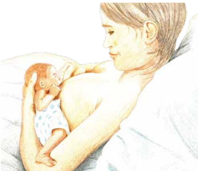
Hohe Rückenhaltung, aufrechte Haltung erleichtert die Koordination von Atmen, Saugen und Schlucken

Achten Sie darauf, bequem und entspannt zu liegen/sitzen. Eine weit geschnittene, weiche, leichte Jacke ermöglicht Ihnen, das Baby und sich selbst etwas zu bedecken, nachdem Sie es sich zusammen bequem gemacht haben. Ihr Arm, der Ihr Baby hält oder Ihr Baby selbst müssen mit einem festen Polster gut gestützt sein, um es während der voraussichtlich längeren Stillzeit immer gut mit dem Mund auf Höhe der Brustwarze halten zu können. Ihr Baby stillt am bequemsten, wenn es in der natürlichen Beugehaltung ist. Helfen Sie ihm, Arme und Beine angebeugt nach vorne zu bringen. Ohr, Schulter und Hüfte sollen auf einer Linie sein. Stabilisieren Sie Ihr Baby, indem Sie den Handballen zwischen seine Schulterblätter legen und Ihre Finger stützen den Kopf. Manche Babys möchten sich erst vom Umlagern erholen und etwas känguruhen, bevor sie anfangen zu stillen.