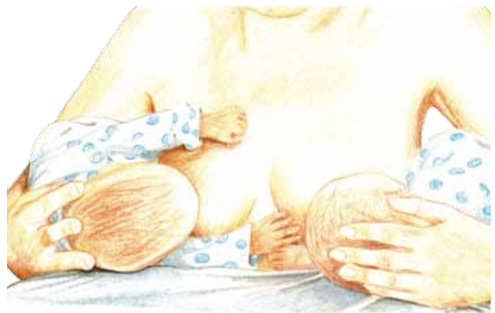
Zwillinge im Rückenhaltung gleichzeitig stillen