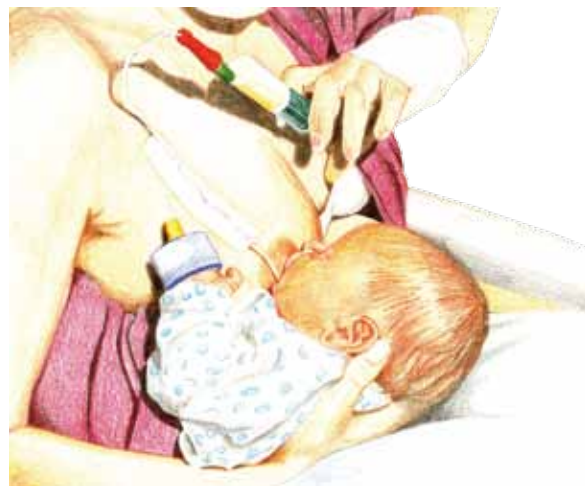
Zufüttern an der Brust