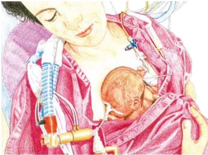
Haut an Haut känguruhen